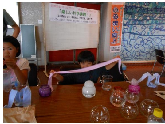
ドライアイスの雪だるま