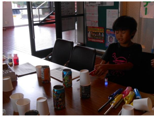
紙コップロケット