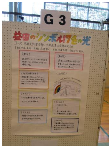
G3 益田のシンボル! 7色の光