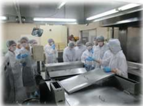
益田クッキングフーズ