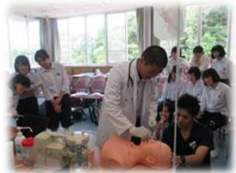
リハビリテーションカレッジシマネ