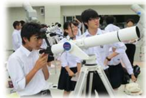
三瓶自然館サヒメル（天文）