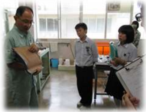
浜田産業技術センター