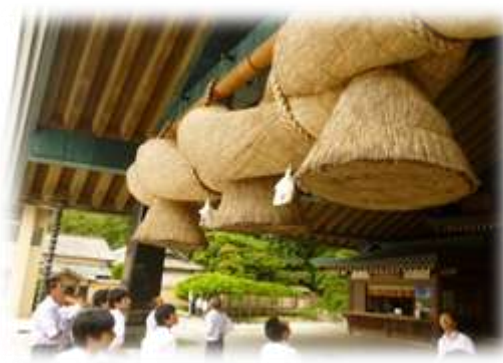
古代出雲歴史博物館