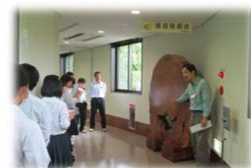
三瓶自然館サヒメル（昆虫）