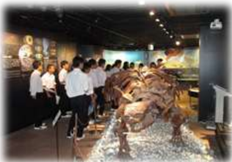
奥出雲多根自然博物館