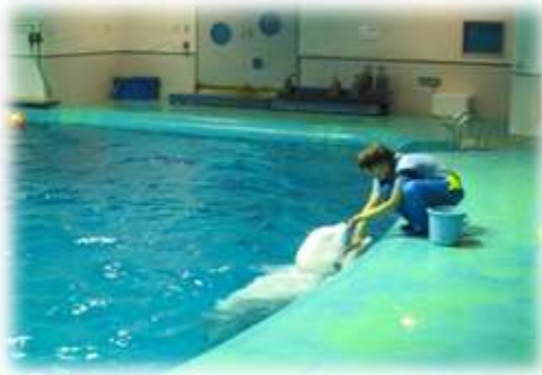
島根海洋館アクアス